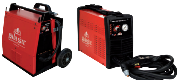
GALA CUT 350K